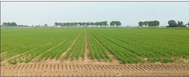
▲ Hollandiában, a nyári napforduló után

tripsszel, ezért mind több termesztő igényli, a fungicides mellett az inszekticides csávázást is a vetőmagon.