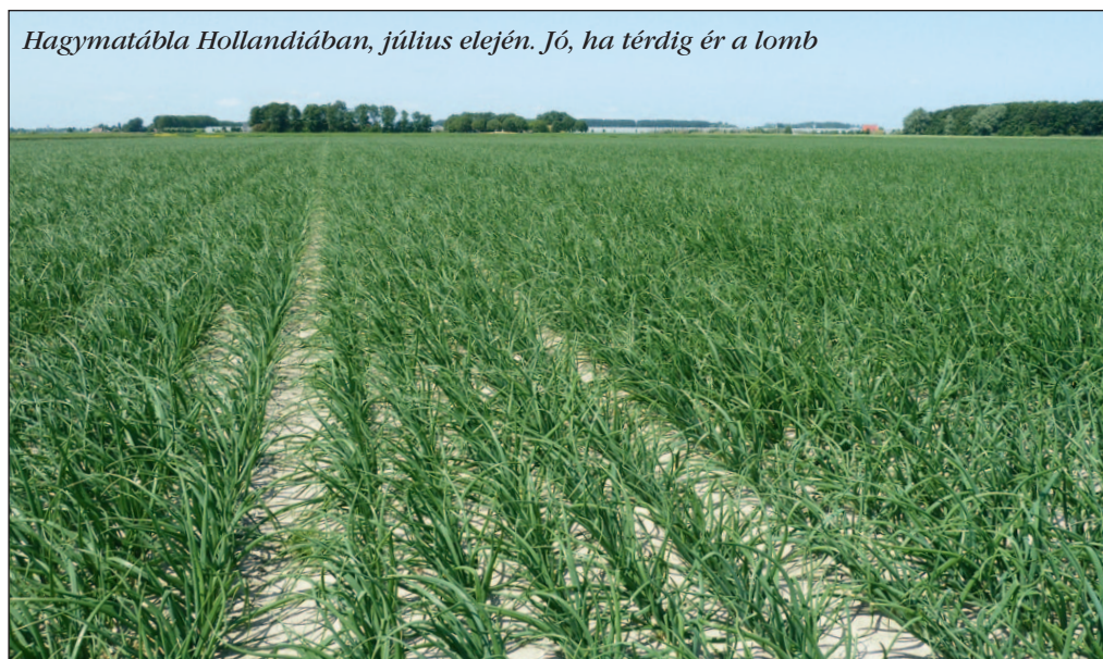
Hagymatábla Hollandiában, július elején. Jó, ha térdig ér a lomb

Az egész Európát érintő időjárási jelenségek Szlovákiát sem kerültk el, a hagymatermés csökkenése azonban nem csak a hidegnek és a rá következő kánikulának tudható be. Északi szomszédaink is áttelelő, dughagymás, és legnagyobb mennyiségben tavaszi vetésű egyéves hagymával foglalkoznak. Néhány termesztő kiegészítésként vet Rijnsburgi fajtákat is, hosszú tárolásra, Szlovákiában azonban már inkább a spanyol-amerikai típusok jellemzőek. Egyre többen küzdenek a