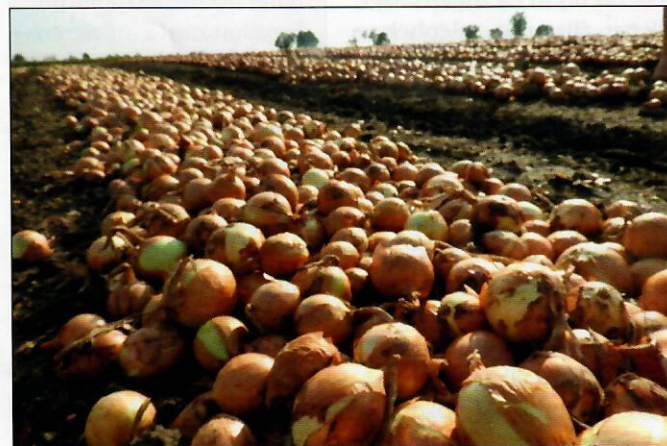
▲ A fő vörshagyma-termőterületek Békés, Csongrád, Bács-Kiskun és Jász-Nagykun-Szolnok, illetve Hajdú-Bihar, Pest és Győr-Moson-Sopron megyékben találhatók