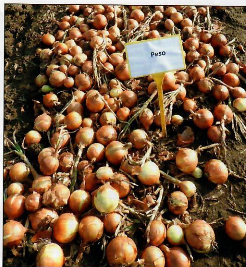
▲ Mutatóshagymafejeket nevel a Peso

A szélsőséges időjárás miatt ugyan kevesebb a termés Bé- készcabán, a nehézségek el- lenére a szakember jó minő- ségről számolt be. Sikerült