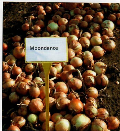
▲ Hosszú tárolásra ajánlott a Moondance