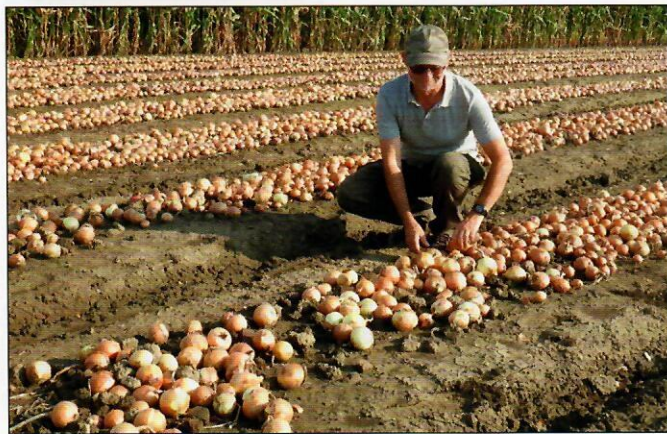
▲ Az éves vörshagyma-fogyasztásunk fejenként 8-9 kilogramm

Egyre ritkább, hogy egy gazdaságban 50 hektárnál nagyobb területen termesztenek hagymát, hangzott el a holland zöldségnevelő Bejo Zaden, és hazai kizárólagos importőre, a Rit-Sat Kft. Békéscsaba-Fényesre szervezett hagymabemutatóján. Ezt nem is elsősorban technológiai hiányosságokkal magyarázhatjuk, ennél a kultúránál is mindinkább a kézimunkaerő a szűk keresztmetszet.